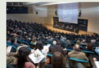
Presentació de l'Aliança Empresarial per a la Vacunació Infantil a CosmoCaixa Barcelona.

Formació de les persones amb responsabilitat directiva de les ONGD a Espanya i a l'Amèrica Llatina, així com dels agents d'acció humanitària.