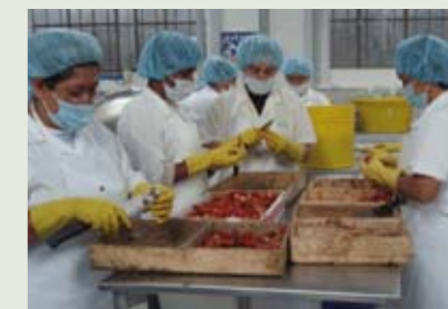
Projecte de suport a l'elaboració de productes de comerç just.